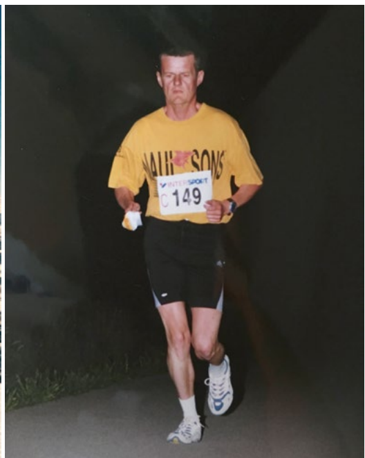
Marathon in ansprechender Zeit.