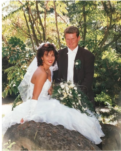
Die Hochzeit folgte schließlich am 29. August 1992 bei siedend heißen Temperaturen im Stift Göttweig.