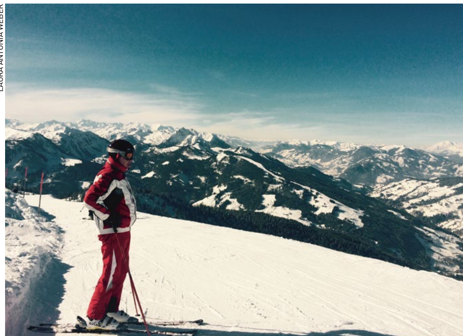
Gern gesehener Gast bei den Hüttenwirten im Schigebiet der Flachau.

- IN DIESEM SINNE: KEEP ON RUNNING UND SCHI HEIL!