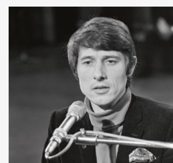
Udo Jürgens mit „Merci Chérie“